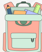
KIT DE CONGRESISTA